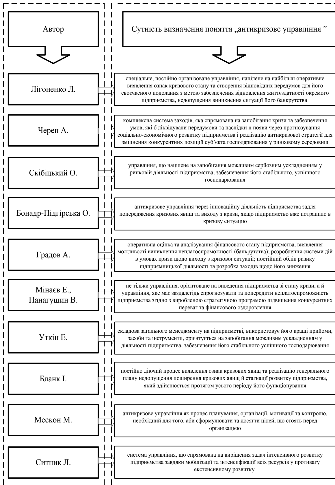
Рис. 1. Аналіз сутності поняття «Антикризове управління»