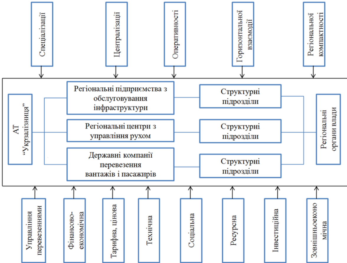
Рис. 1. Структура функціонально-об'єктної системи реформування залізниць України