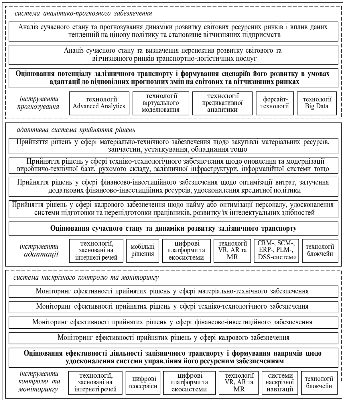
Рис. 2. Прогнозно-адаптивний підхід до управління ресурсним забезпеченням розвитку залізничного транспорту (авторська розробка)

компанії. Оскільки саме від якості аналізу ринків ресурсів та прогнозування динаміки їх розвитку і оцінювання потенціалу залізничного транспорту щодо адаптації до цих змін залежить ефективність управлінських рішень і стабільність розвитку залізничного транспорту (рис. 2).