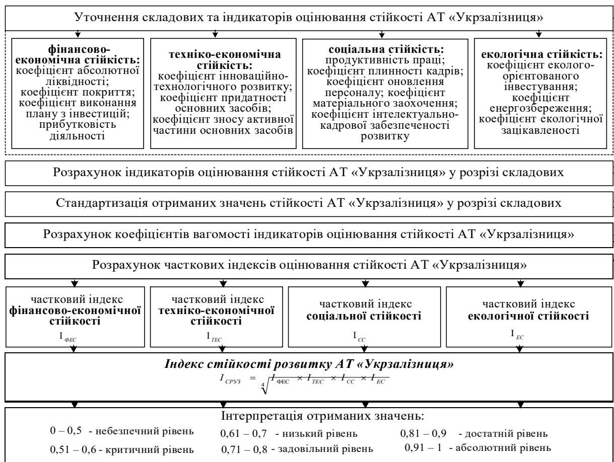
Рис. 2. Послідовність оцінювання стійкості розвитку АТ «Укрзалізниця»

придатності основних засобів, зносу активної частини основних засобів; соціальної стійкості – продуктивність праці, коефіцієнти плинності кадрів, коефіцієнти оновлення персоналу, матеріального заохочення, інтелектуально-кадрової забезпеченості розвитку; екологічної стійкості – коефіцієнти еколого-орієнтованого інвестування, коефіцієнти енергозбереження та екологічної зацікавленості.