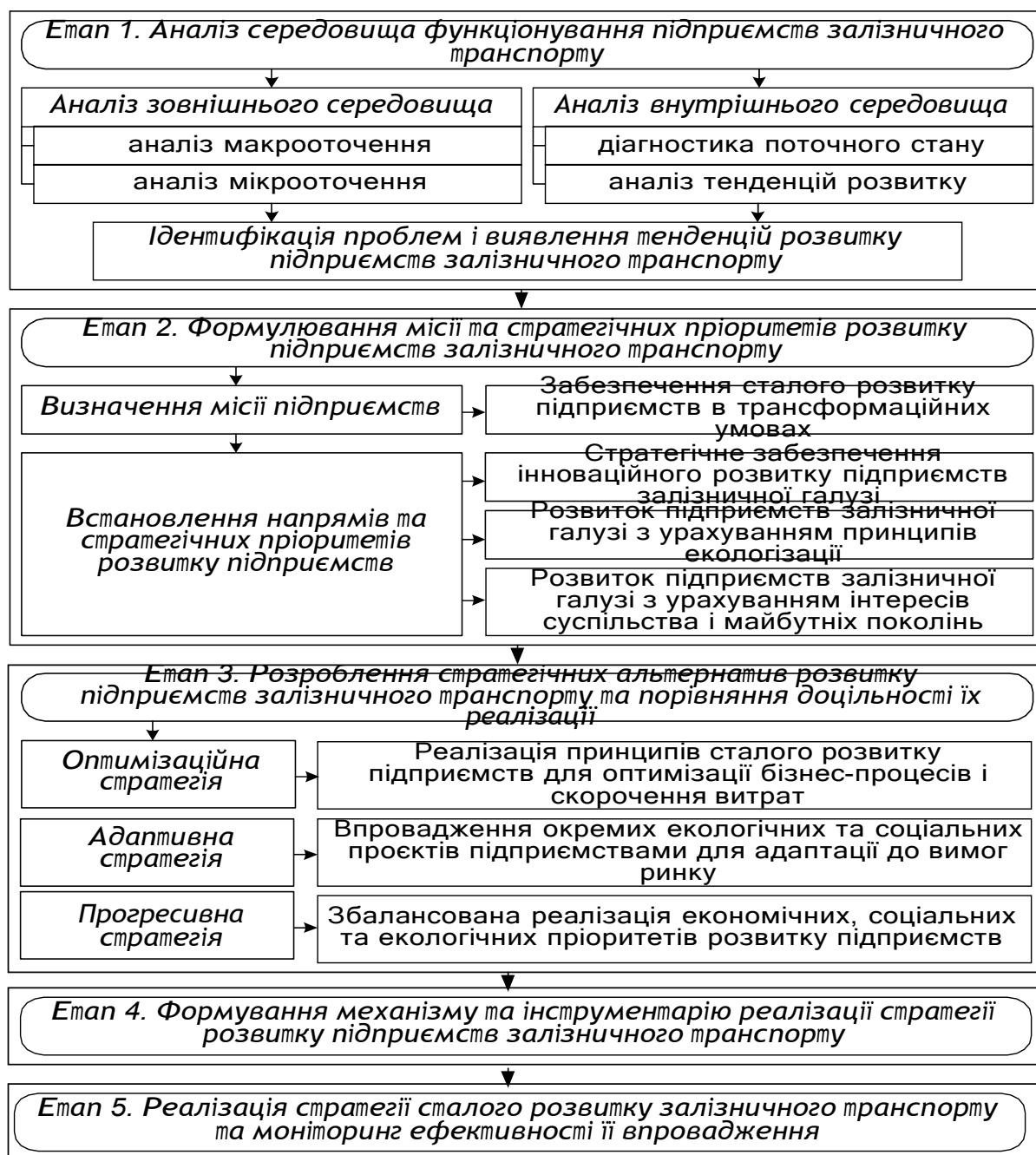
Рис. 4. Технологія формування та реалізації стратегії сталого розвитку підприємств залізничного транспорту (розробка автора)

Етап 1. Аналіз середовища функціонування підприємств залізничного транспорту, що передбачає аналіз зовнішнього середовища (макро- та мікрооточення), аналіз внутрішнього середовища (діагностика поточного стану, аналіз тенденцій розвитку), і на цій основі ідентифікацію проблем і виявлення тенденцій розвитку підприємств