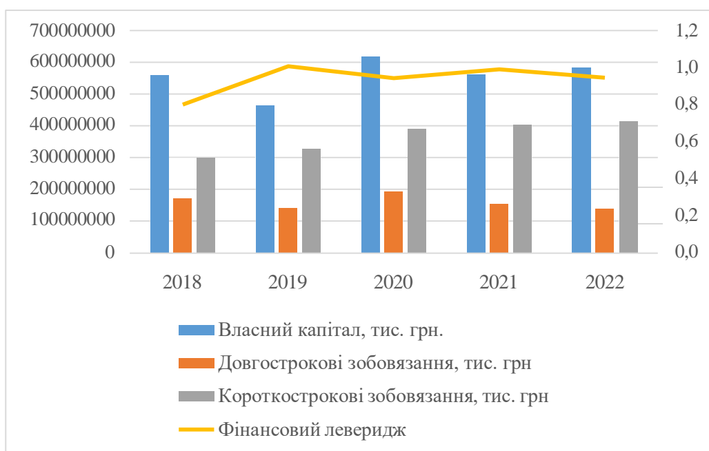
Рис. 4. Динаміка елементів капіталу суб'єктів господарювання за видом економічної діяльності «транспорт, складське господарство, поштова та кур'єрська діяльність». Джерело: складено за даними [11].

порівняно з довгостроковими. У 2018-2022 році підприємства за видом економічної діяльності «транспорт, складське господарство, поштова та кур'єрська діяльність» характеризувалися високою часткою власного капіталу, що становила понад 50% та значною часткою поточних зобов'язань 30-40% (рис. 4).