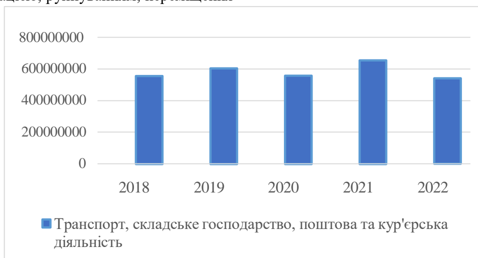
Рис. 2. Динаміка обсягів реалізованої продукції суб'єктів господарювання транспортної галузі.

Рівень фінансової безпеки суб'єктів господарювання визначається зміною обсягу реалізованої продукції (рис. 2) через вплив на доходи, ліквідність, інвестиційну привабливість та інші аспекти фінансової діяльності.