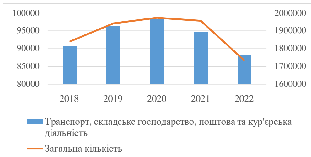
Рис. 1. Кількість діючих суб'єктів господарювання за видом економічної діяльності «транспорт, складське господарство, поштова та кур'єрська діяльність»

галузі досліджено стан галузі. Кількість діючих суб'єктів господарювання свідчить про рівень підприємницької активності та вказує на безпечність середовища для функціонування підприємств в Україні (рис. 1).