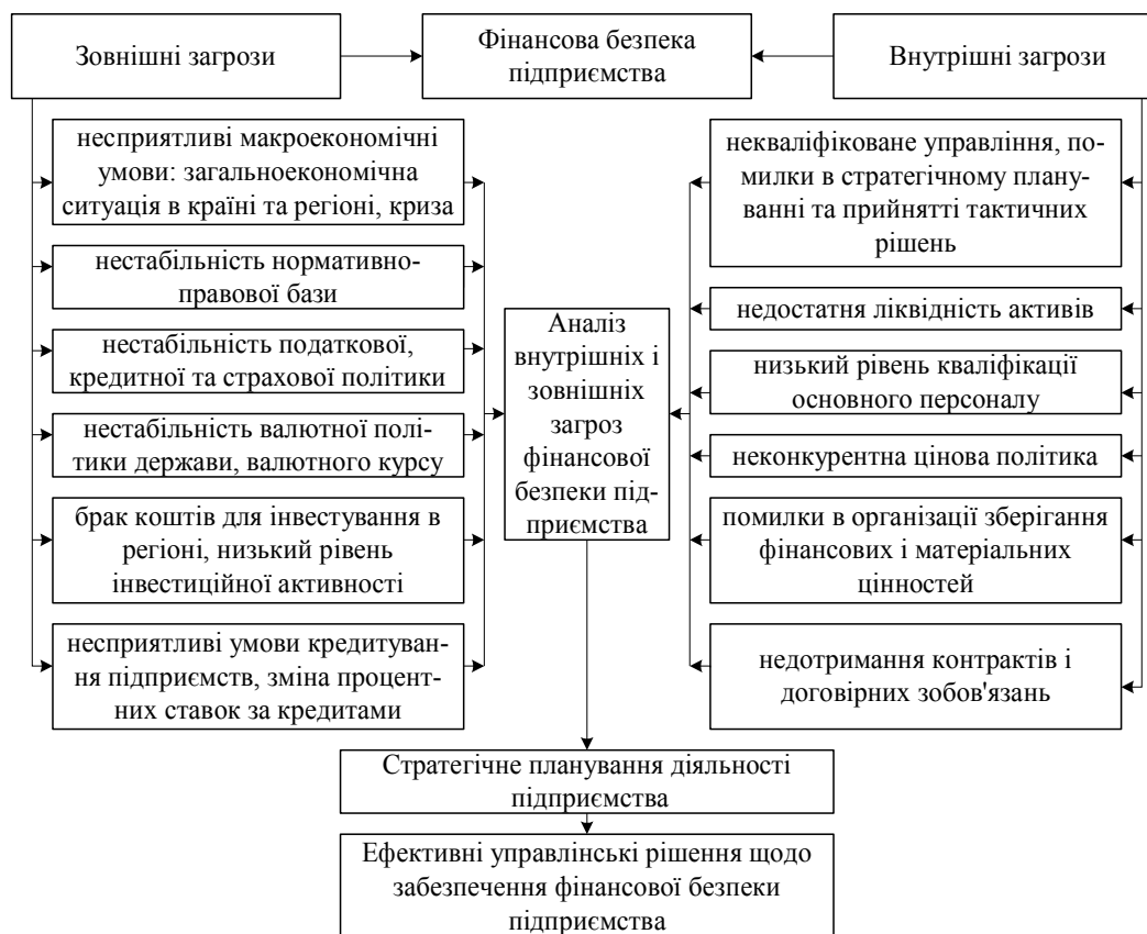
Рис. 2. Аналіз загроз, які впливають на фінансову безпеку підприємства

спроможні уникнути можливих загроз і ліквідувати шкідливі наслідки окремих негативних складових зовнішнього і внутрішнього середовища. Аналіз загроз, які впливають на фінансову безпеку підприємства представлені на рис. 2.