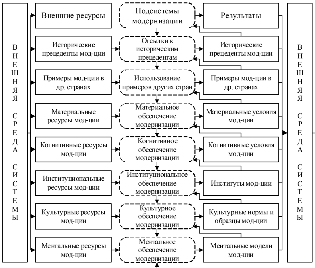
Рис. 1. Функциональная структура комплексной модернизации [12]

Если рассматривать страновую модернизацию как систему, эту структуру необходимо специфицировать, уточнив свойственные именно для такой системы элементы ее внутренней структуры и, входы и выходы функциональных подсистем. Результаты представлены на рис. 1.