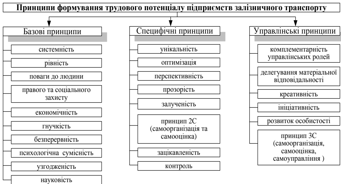
Рис. 2 - Система принципів формування трудового потенціалу підприємств залізничного транспорту (сформовано автором)

Група специфічних принципів визначає умови формування та розвитку трудового потенціалу кожного підприємства залізничного транспорту, його компонентів, характерні для культури, традицій, вимог та цінностей, що склалися на підприємстві.