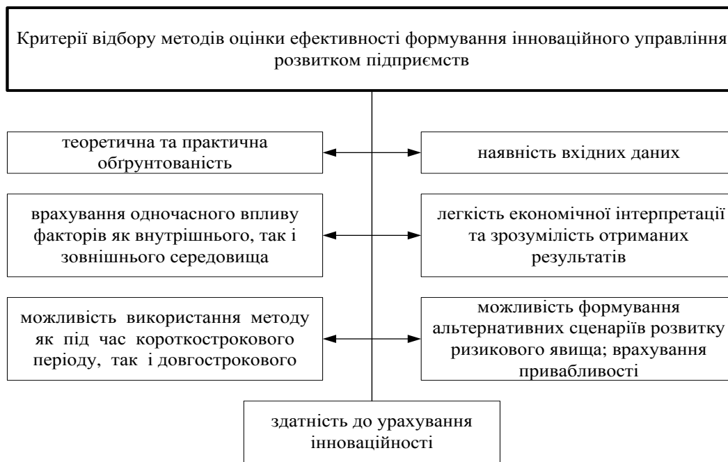
Рис. 2. Критерії відбору методів оцінки ефективності формування інноваційного управління розвитком підприємств

Діяльність підприємства здійснюється під впливом зовнішнього і внутрішнього середовища, тому, оцінка інноваційного управління розвитком підприємства дозволяє виявити резерви його збільшення як всередині, так і зовні з метою формування стратегічного розвитку та підвищення конкурентоспроможності.