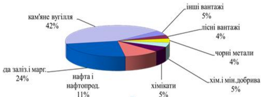
Рис. 2 Структура обсягів транзитних перевезень залізничним транспортом за 2017 рік

За звітний період збільшилися обсяги перевезень вугілля кам'яного (+4 258,5 тис. тонн) до 8 млн. тонн, лісних вантажів (+325,3 тис. тонн) до 716 тис. тонн та хімікатів (+291 тис. тонн) до 1 млн. тонн.