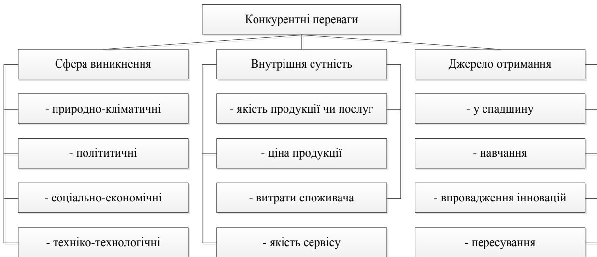
Рис. 3. Класифікація конкурентних переваг за Р. Фатхутдіновим [19]

У наш час велике значення для підприємства має класифікація конкурентних переваг за джерелами їх виникнення, бо саме вона відображає шляхи формування кожної окремої конкурентної переваги та можливості їх повторення іншими підприємствами. У численних дослідженнях [3, 7, 8, 14, 17] конкурентні переваги підприємства за цією ознакою поділяються на конкурентні переваги низького, високого та найвищого рівнів. До конкурентних переваг низького рівня відносять ті, які мають за основу вартість чи доступність факторів виробництва. Такі конкурентні переваги занадто підприємство отримує занадто легко, а, отже, вони не є унікальними, не забезпечують стабільності функціонування та притаманні всім учасникам ринку. Конкурентні переваги високого рівня