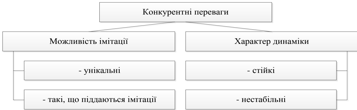
Рис. 2. Класифікація конкурентних переваг за Г. Азоєвим [1]