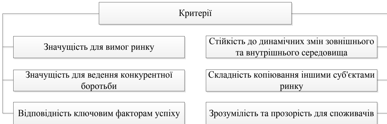
Рис. 4. Критерії відношення характеристик підприємства до конкурентних переваг

Управління конкурентними перевагами, процесом їх формування, розвитку і підтримання є складною задачею, вирішення якої, в першу чергу, залежить від побудованої на підприємстві системи менеджменту, її продуктивності, результативності, сприйнятливості та збалансованості. Незбалансованість, на разі, є основною причиною низької ефективності управління конкурентними перевагами підприємства (рис. 5).