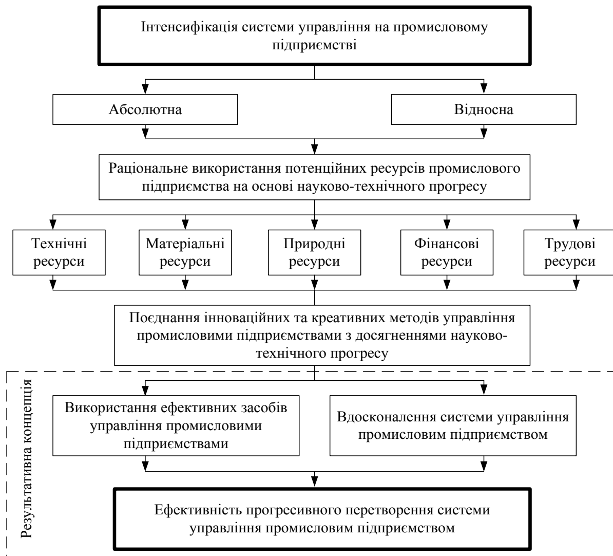
Рис. 2. Інтенсифікації системи управління промисловими підприємствами як необхідна умова забезпечення ефективності прогресивних перетворень

Вироблення, прийняття, реалізація та контроль за виконанням управлінських рішень пов'язані з виконанням за змістом робіт, пов'язаних з підготовкою інформації, необхідної для розробки і прийняття ефективних управлінських рішень, а також з організацією їх виконання.