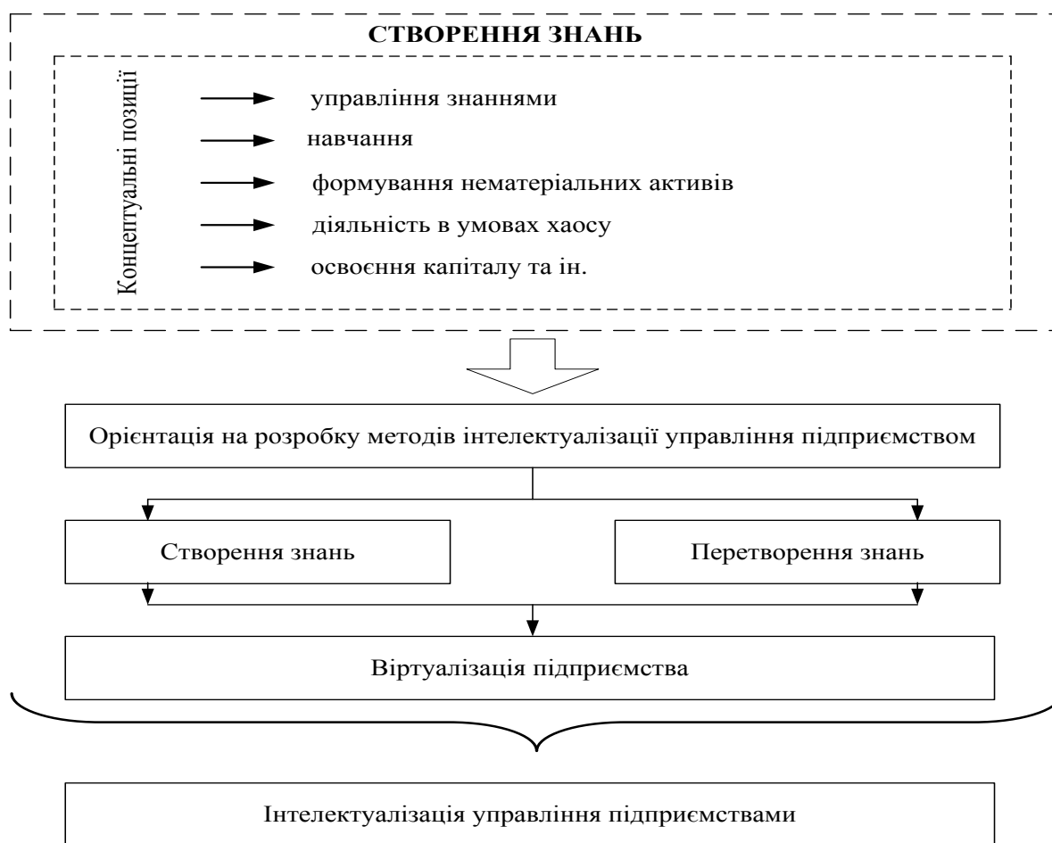
Рис. 1. Інтелектуалізації управління підприємствами як процес перманентного генерування знань

Отже, процеси інтелектуалізації управління підприємствами ототожнювались згідно ідеологічних платформ та різних концептуальних позицій (рис.1).