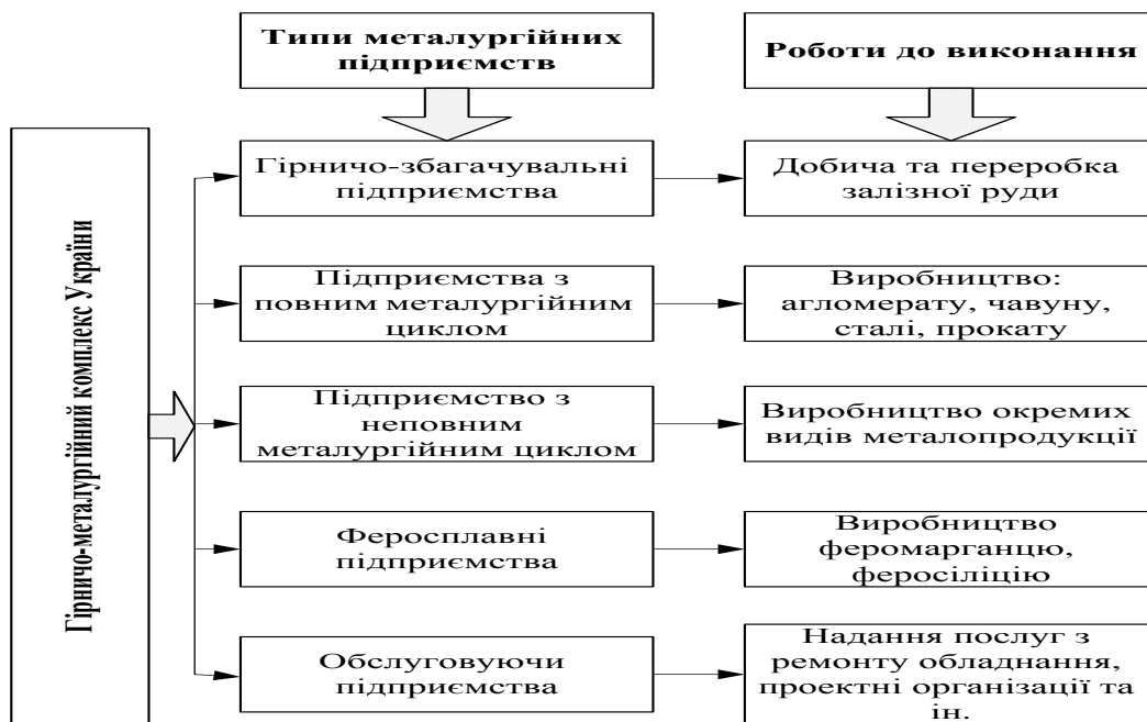
Рис. 1. Узагальнена характеристика підприємств гірничо-металургійного комплексу України

концентрат, окатиші і кускову руду, феросплави, чавун, напівфабрикати (квадратну заготовку, сляби, трубну заготовку), готовий прокат, в тому числі плоский гарячекатаний і холоднокатаний прокат в рулонах і листах, рейки, арматурну сталь і катанку, профільний прокат, а також вироби подальшого переділу - сталеві труби, металовироби, прокат з покриттями та ін.