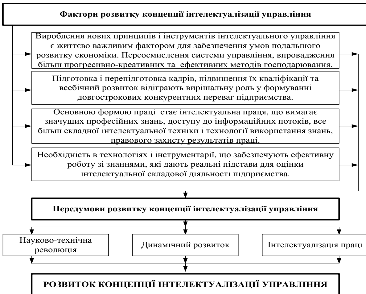
Рис. 2. Фактори та передумови розвитку концепції інтелектуалізації управління

Фактори та передумови розвитку концепції інтелектуалізації управління наведено на рис.2.