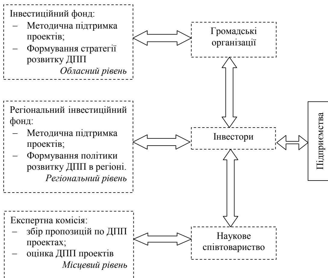
Рис. 3. Модель регулювання діяльності підприємницьких структур через реалізацію концесійних угод*