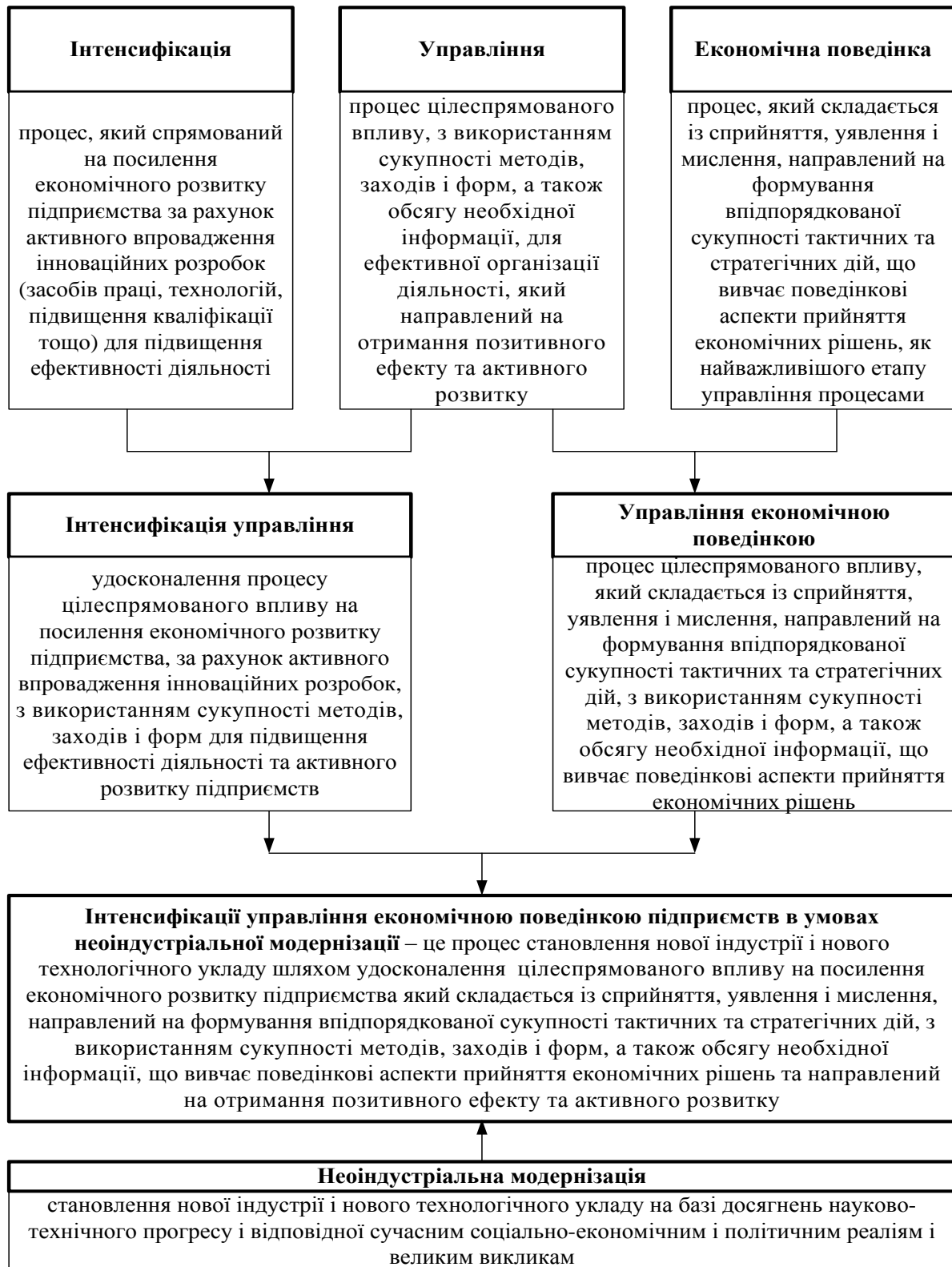
Рис.2. Діалектичний підхід до формування теоретичних основ інтенсифікації управління економічною поведінкою підприємств в умовах неоіндустріальної модернізації