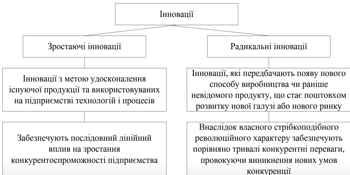
Рис. 1. Класифікація інновацій за результатами впливу на конкурентоспроможність суб'єкта господарювання

З огляду на важливість впливу інновацій на конкурентоспроможність суб'єкта господарювання, на нашу думку, доцільно виділити два укрупнених їх види: зростаючі інновації та радикальні інновації (рис. 1).