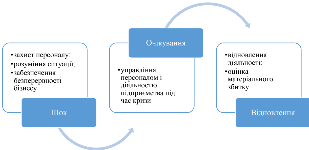
Рис. 3. Основні цикли антикризового управління в умовах пандемії (розроблено авторами)

Антикризове управління в умовах пандемії доцільно зосередити у трьох основних циклів (рис. 3).