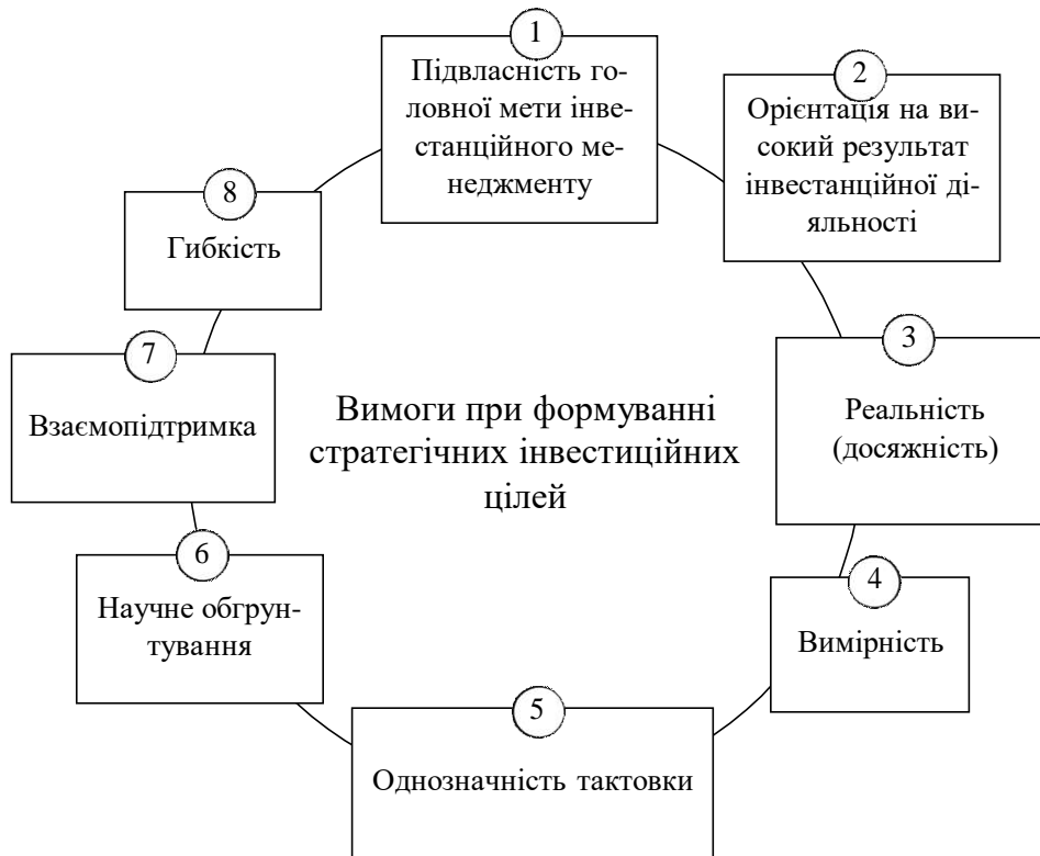
Рис. 2 — Головні вимоги, що представляються до формуванню стратегічних інвестиційних цілей при реалізації інвестиційного проекту

З урахуванням розглянутих вимог організується процес формування стратегічних цілей інвестиційної проектів. Цей процес здійснюється за наступними основними етапами (рисунок 3). Ретроспективний аналіз тенденцій розвитку основних результативних показників інвестиційної діяльності полягає в ув'язуванні з динамікою факторів зовнішнього інвестиційного середовища і параметрами внутрішнього інвестиційної потенціалу об'єктів Національній мережі МТК. Основна задача такого аналізу полягає у виявленні закономірностей і особливостей розвитку найважливіших параметрів інвестиційної діяльності окремих об'єктів стратегічного керування і встановленні ступеня впливу на них різних зовнішніх і внутрішніх факторів.