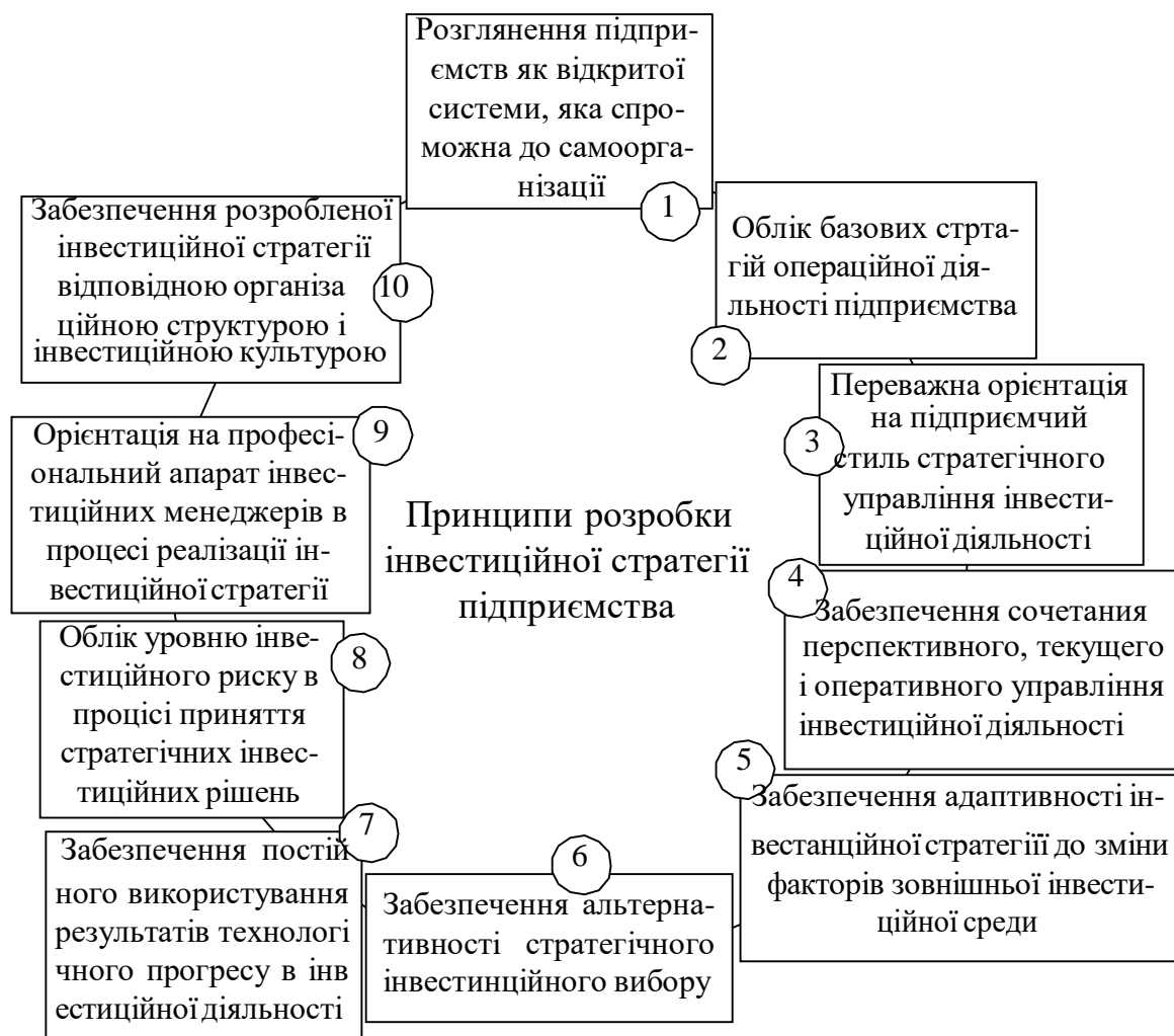
Рис. 1 — Головні принципи розробки інвестиційної стратегії

стратегічних інвестиційних рішень у підприємства, відносяться (рисунок 1): процесі розробки інвестиційної стратегії