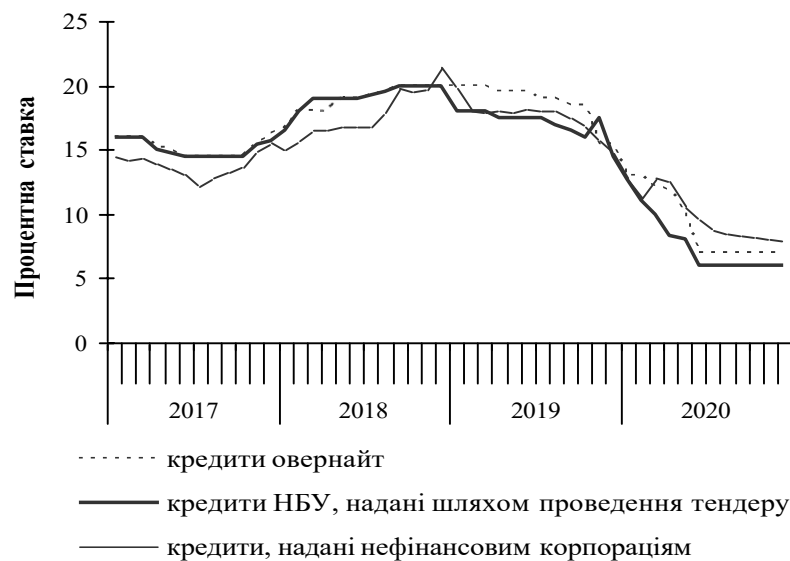
Рис. 3. Процентні ставки рефінансування банків НБУ та процентні ставки за короткостроковими кредитами, наданими депозитними корпораціями нефінансовим корпораціям, %

Уявлення про вплив процентної ставки за кредитами, наданими НБУ комерційним банкам і характер цієї політики в Україні за останні роки дають наступні дані (рис. 3).