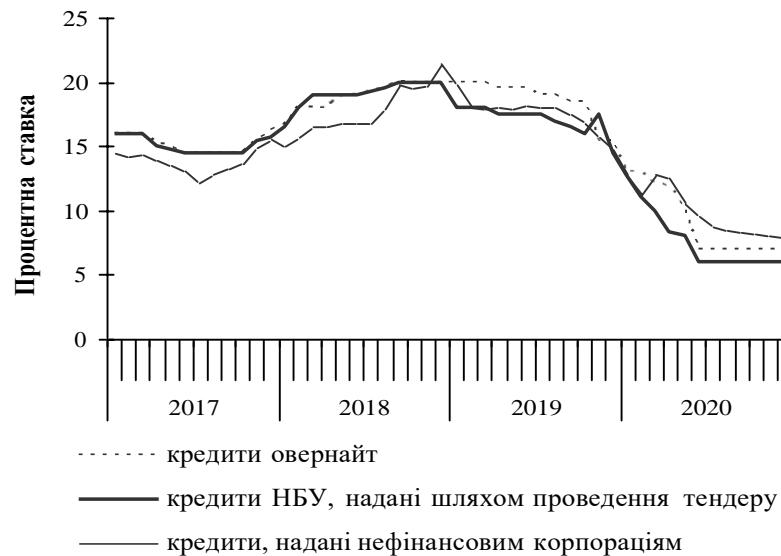
Рис. 3. Процентні ставки рефінансування банків НБУ та процентні ставки за короткостроковими кредитами, наданими депозитними корпораціями нефінансовим корпораціям, %

Уявлення про вплив процентної ставки за кредитами, наданими НБУ комерційним банкам і характер цієї політики в Україні за останні роки дають наступні дані (рис. 3).