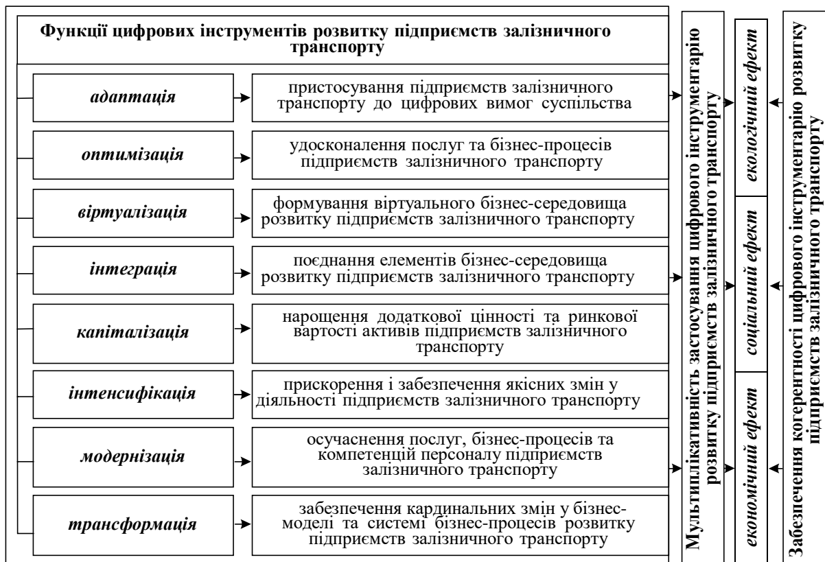
Рис. 2. Функції цифрового інструментарію розвитку підприємств залізничного транспорту і умови їх успішного застосування (розробка автора)

розвитку підприємств залізничного транспорту; капіталізація – у нарощенні додаткової цінності та ринкової вартості активів підприємств залізничного транспорту; інтенсифікація – у прискоренні і забезпеченні якісних змін у діяльності підприємств залізничного транспорту; модернізація – в осучасненні послуг, бізнес-процесів та компетенцій персоналу підприємств залізничного транспорту; трансформація – у забезпеченні кардинальних змін у бізнес-моделі та системі бізнес-процесів розвитку підприємств галузі. Тобто, впровадження цифрового інструментарію в діяльність вітчизняних підприємств залізничного транспорту сприятиме використанню мультиплікативних властивостей цифровізації, що виражаються в можливості досягнення підприємствами галузі поряд з економічними соціальних та екологічних цілей їх зростання.