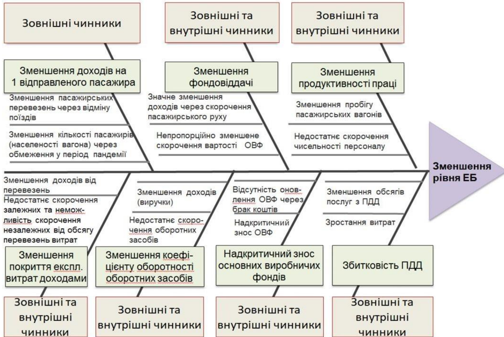
Рис. 2 Діаграма Ісікави чинників зменшення рівня ЕБ Полтавської вагонної дільниці (у 2020 р. порівняно з 2019 р.)