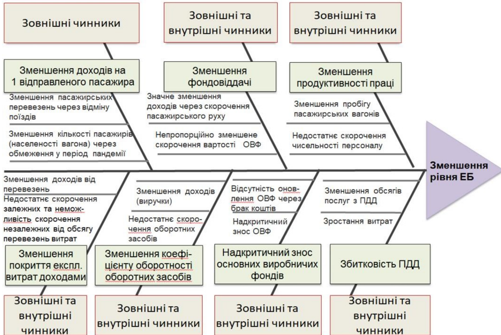
Рис. 2 Діаграма Ісікави чинників зменшення рівня ЕБ Полтавської вагонної дільниці (у 2020 р. порівняно з 2019 р.)