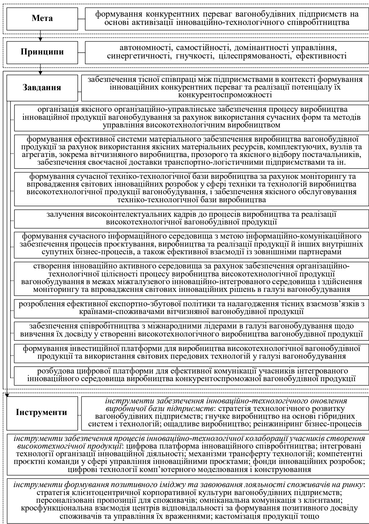
Рис. 2. Концептуальні положення забезпечення конкурентоспроможності вагонобудівних підприємств в умовах активізації процесів інноваційно-технологічної колаборації