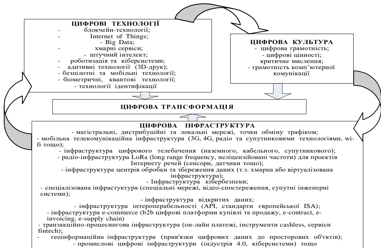
Рис. 1. Ключові елементи забезпечення цифрової трансформації (сформовано на основі [13])

Варто вказати на те, що успіх процесу цифрової трансформації залежить від правильності обраних для його реалізації елементів. Сьогодні серед науковців існує думка, що зміст процесу цифрової трансформації характеризується такими категоріями, цифрові дані, цифрова інфраструктура, цифрові моделі та цифрова економіка. На думку авторів статті, якість цифрової трансформації залежить від прогресивності впроваджуваних технологій, дієвості цифрової інфраструктури, рівня розвитку цифрової культури та цифрового бачення майбутнього підприємства (рис. 1).