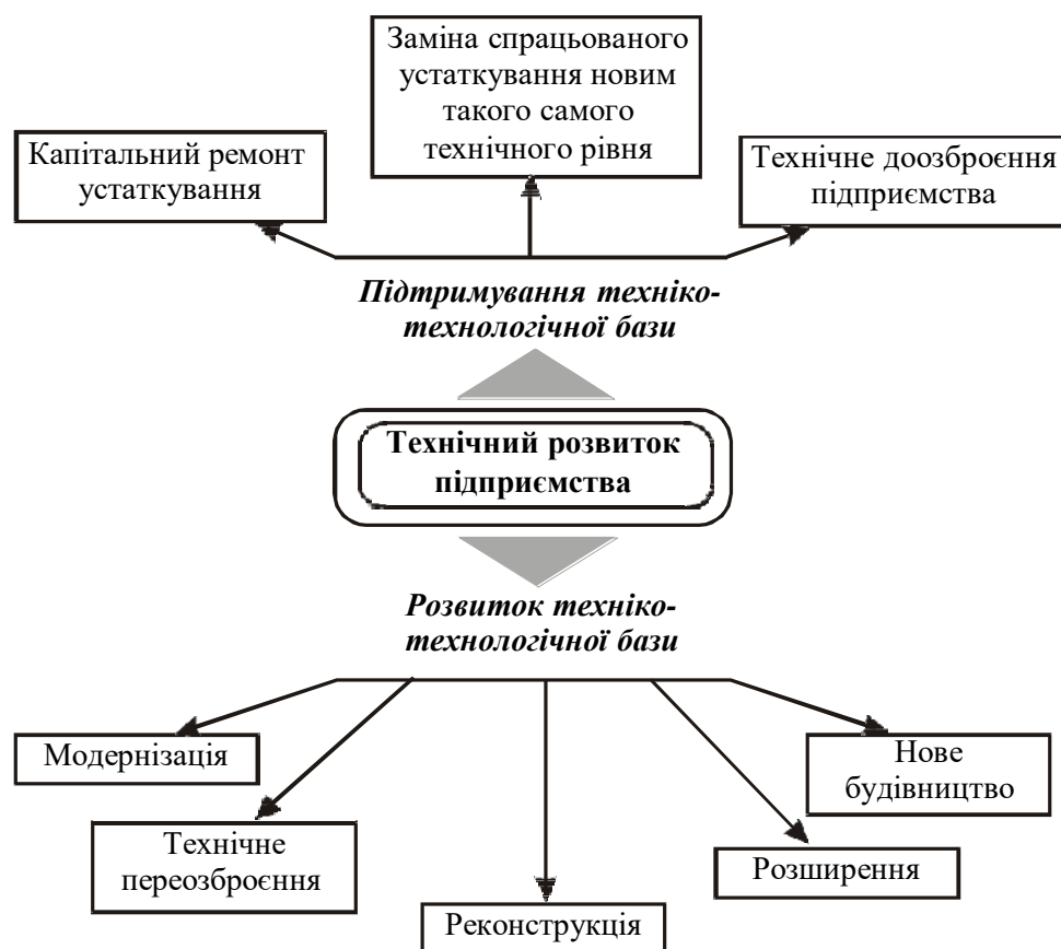
Рис. 2. Форми технічного розвитку підприємства