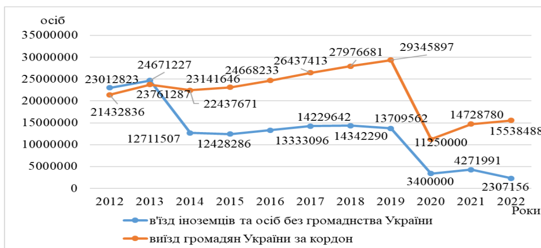
Рис.1. Динаміка в'їзних та виїзних туристичних потоків протягом 2011-2022 років [11-12]

особами в більшості для пошуку безпечного місця перебування. Діловий туризм реалізується виключно за рахунок відвідувань країни міжнародних партнерів задля підтримки нашої держави в умовах воєнних дій.