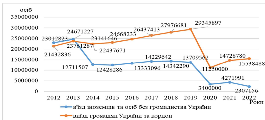
Рис.1. Динаміка в'їзних та виїзних туристичних потоків протягом 2011-2022 років [11-12]

особами в більшості для пошуку безпечного місця перебування. Діловий туризм реалізується виключно за рахунок відвідувань країни міжнародних партнерів задля підтримки нашої держави в умовах воєнних дій.