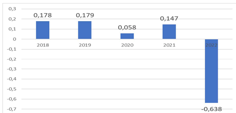
Рис. 1. Рівень ЕБ Харківського метрополітену в 2018 - 2022 рр.

Це вимагає не тільки якнайшвидшого розроблення заходів по його підвищенню, а й організації такої роботи на постійній основі.