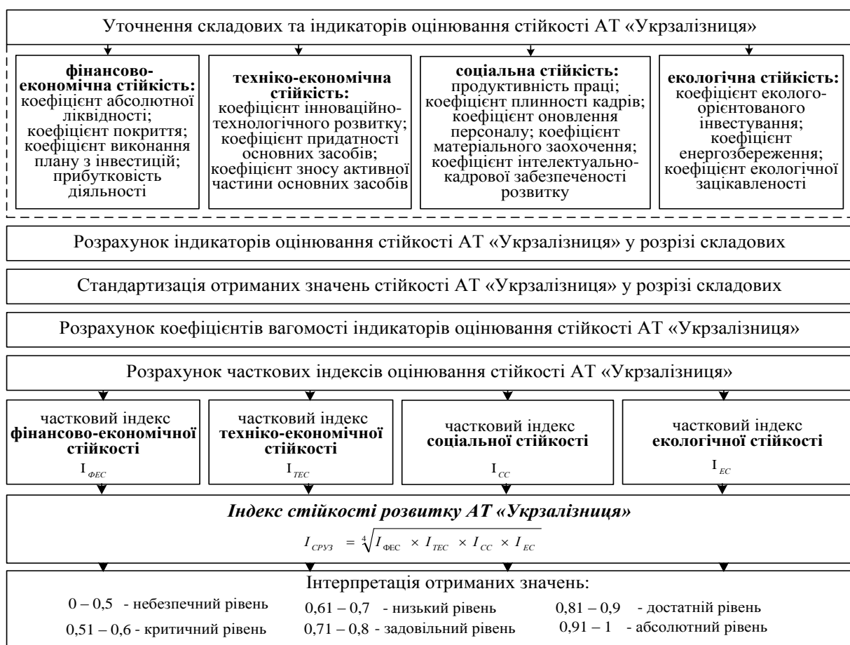
Рис. 2. Послідовність оцінювання стійкості розвитку АТ «Укрзалізниця»

придатності основних засобів, зносу активної частини основних засобів; соціальної стійкості – продуктивність праці, коефіцієнти плінності кадрів, коефіцієнти оновлення персоналу, матеріального заохочення, інтелектуально-кадрової забезпеченості розвитку; екологічної стійкості – коефіцієнти еколого-орієнтованого інвестування, коефіцієнти енергозбереження та екологічної зацікавленості.