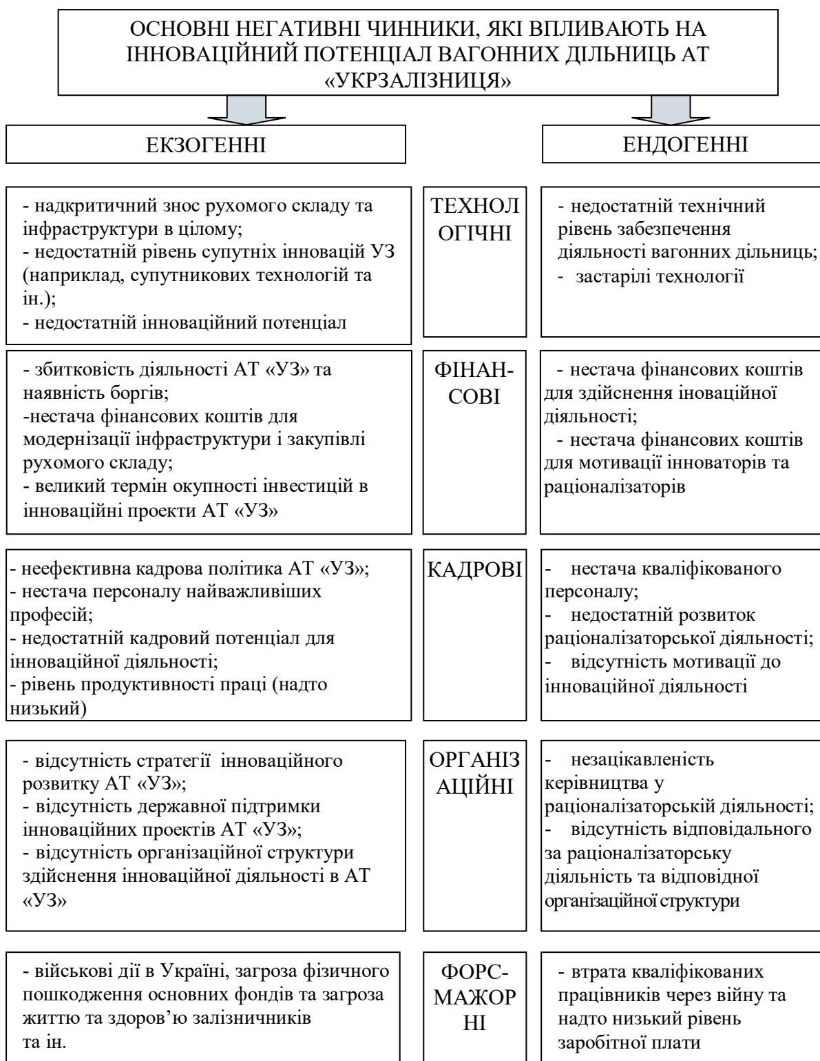
Рис. 1. Класифікація чинників впливу на інноваційний потенціал вагонних дільниць