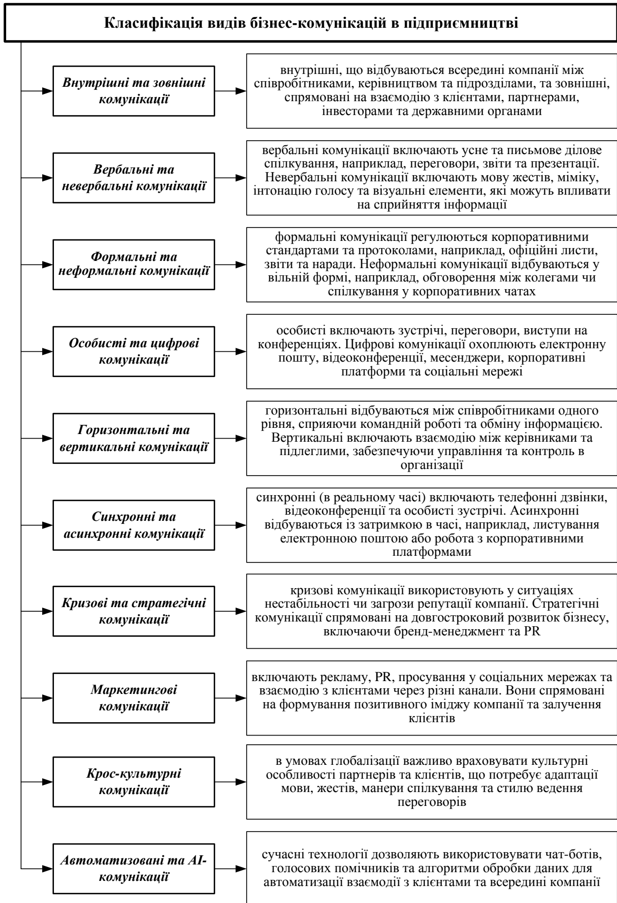
Рис. 1. Класифікація видів бізнес-комунікацій в підприємстві