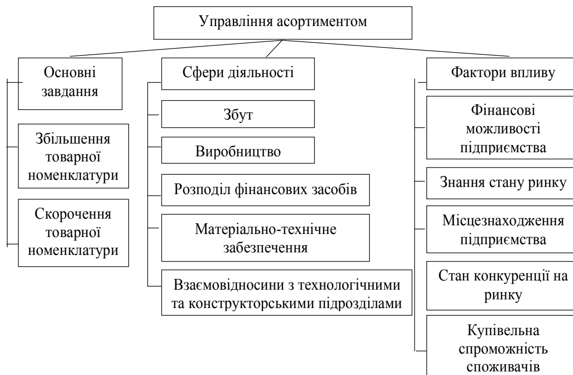
Рис. 1. Сутність управління асортиментом на підприємстві

Управління асортиментом є складною задачею, яка сьогодні стоїть як перед торговими, так і перед виробничими підприємствами. Основні завдання, які повинні вирішуватися у рамках управління асортиментом, стосуються збільшення або скорочення товарної номенклатури підприємства. Ці рішення повинні ґрунтуватися на цілому комплексі маркетингових, фінансових і стратегічних підходів [2, с. 818]. Тому сьогодні є загальноновизнаним й факт, що планування та управління асортиментом – це важлива й невід’ємна частина маркетингу. Ефективне управління асортиментом поєднує декілька видів діяльності, а саме науково-технічну проекту діяльність, комплексне дослідження ринку, організацію збуту, сервіс, рекламу, стимулювання попиту. Остаточна мета цих заходів — оптимізація асортименту з урахуванням стратегічних ринкових цілей підприємства. Принциповими рішеннями в процесі управління асортиментом вважаються рішення щодо зняття з виробництва нерентабельних видів продукції, її окремих моделей, типорозмірів; визначення необхідності проведення досліджень для створення нової продукції та модифікації існуючої; затвердження планів і програм розробки нових товарів або поліпшення наявних продуктів; надання фінансових ресурсів для втілення затверджених програм і планів.