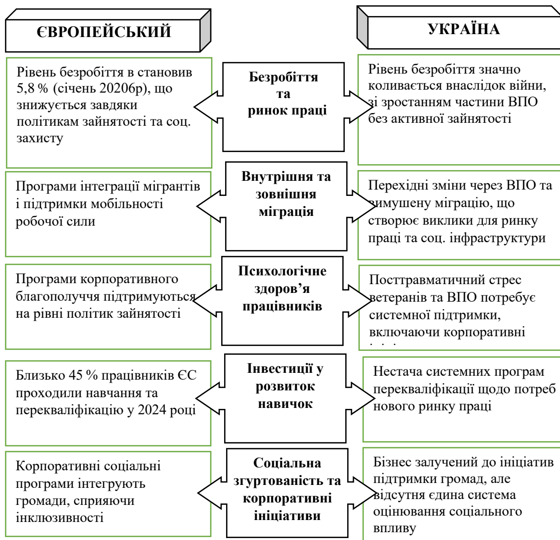
Рис. 2. Порівняння соціальних показників та ефектів-інвестицій у сфері людського капіталу: ЄС та Україна. Складено за [28-31]

перекваліфікації відповідно до потреб ринку праці, а також розвиток партнерств між бізнесом і громадами з метою соціальної підтримки та економічного зростання.